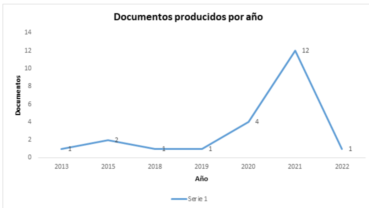
Gráfico 1. Distribución de documentos producidos por año.

Se evidencia en el Gráfico 1, respecto a documentos publicados durante los años 2013 a 2022, en el año 2021 (12) documentos fueron publicados que fue mayor con respecto a la evaluación formativa debido a la situación de la pandemia de la COVID-19 que atravesó el Perú y el mundo, mientras que durante el año 2020 se publicó (04) producciones, en el año 2013 (02) publicaciones, mientras tanto durante los años 2013, 2018, 2019 y a inicios del mes de marzo del año 2022 (01) producciones sobre evaluación formativa que fueron publicados en revistas indizadas.