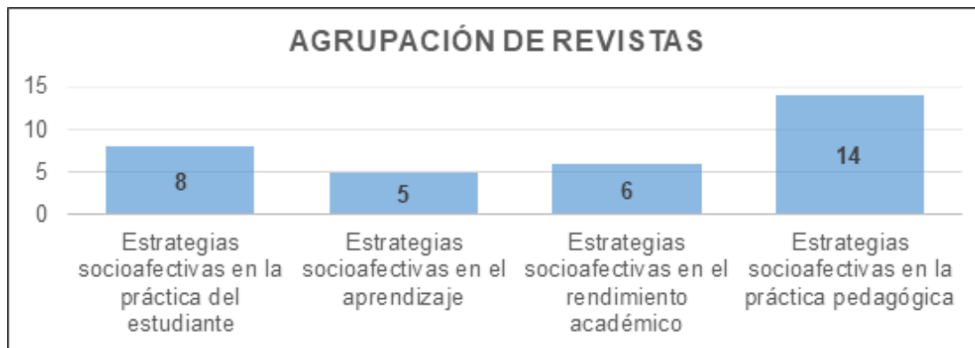
Gráfico 1. Agrupación de artículos por sus características.