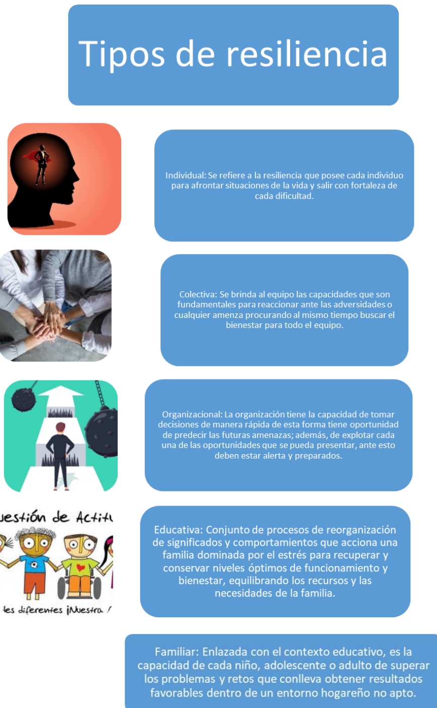
Cuadro 2. Tipos de resiliencias

Existen diversos tipos de resiliencia que se encuentran dentro de diferentes contextos (Gobernación de Antioquia, 2015). Como se detalla en el cuadro 2.