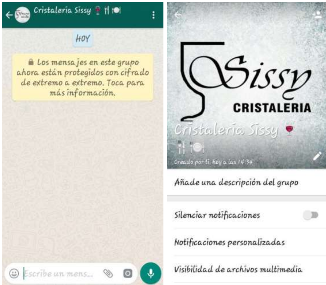
Figura 8. Diseño del grupo de WhatsApp “Cristalería Sissy”. Grupo creado por la administradora