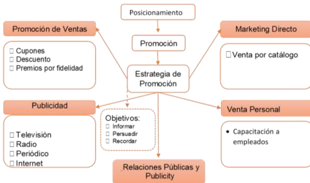
Figura 1. Estructura de la propuesta. Adaptado de “Fundamentos de marketing”, Monferrer, D., 2013, pp.155-171, Recuperado de http://repositori.uji.es/xmlui/bitstream/handle/10234/49394/s74.pdf