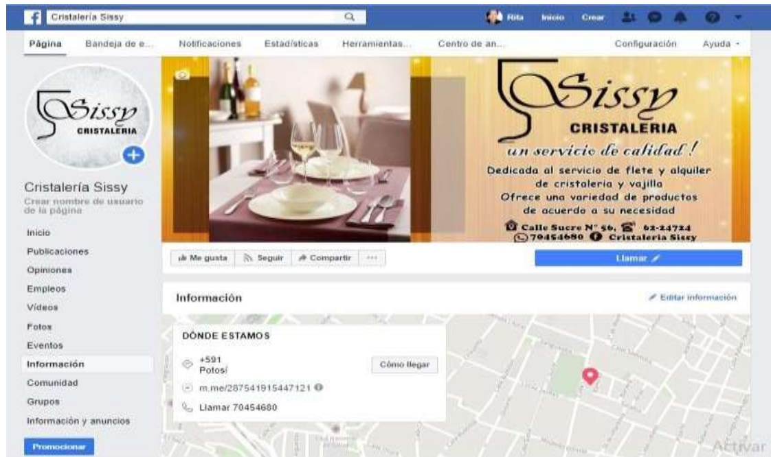
Figura 6. Diseño de página de Facebook “Cristalería Sissy”. Extraído de https://www.facebook.com/Cristaler%C3%ADa-Sissy-287541915447121/?modal=admin_todo_tour

Esta página permitirá promocionar el servicio. La información de la Cristalería en esta página hace que las personas interesadas puedan llamar y preguntar sobre el servicio que requiere.