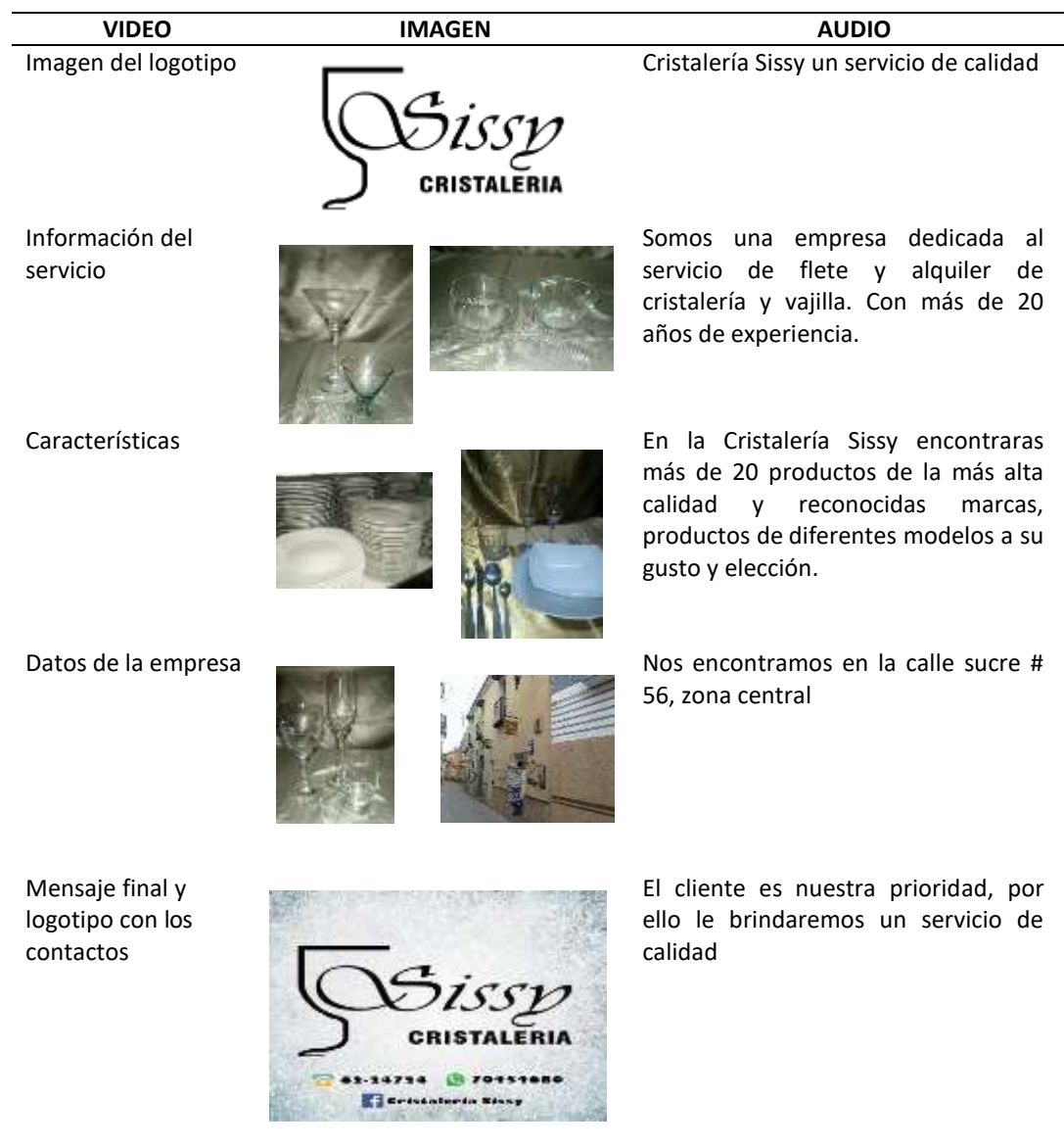
Tabla 3. Diseño del spot publicitario

El spot publicitario ira acompañado con el audio musical de fondo "Life's happy journey"