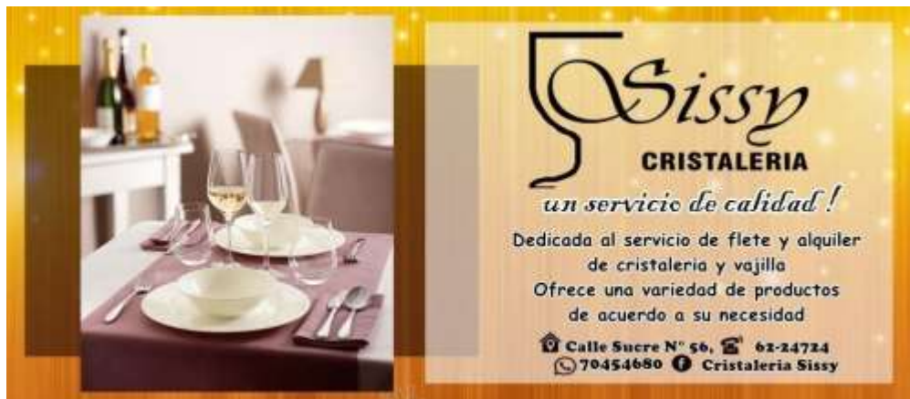
Figura 5. Diseño de publicidad en el periódico

A continuación se presenta el diseño del anuncio publicitario en el periódico El Potosí con el logo de la cristalería, el servicio que ofrece y los datos de la empresa.