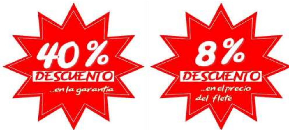
Figura 3. Diseño de anuncio de descuento

A continuación se presenta el diseño de los anuncios de descuento a la vista del cliente: