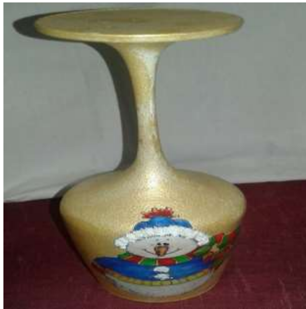
Figura 4. Premios por fidelidad. Fotografías tomadas de los adornos navideños realizados por la administradora

productos que lleguen a desportillarse, rajarse o maltratarse, y adornos o pintura que la administradora y el personal tienen a disposición, es decir, se realizara con material reciclado, por lo tanto no se incurrirá en ningún gasto. A continuación, un ejemplo de los premios que se otorgará a los clientes fieles hecho por la administradora.