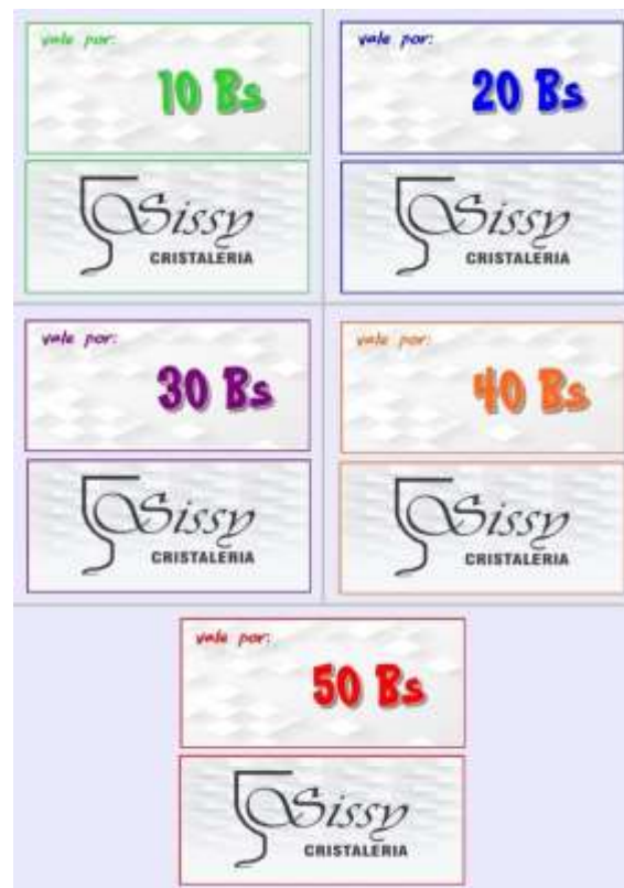
Figura 2. Diseño de cupones o vales certificados