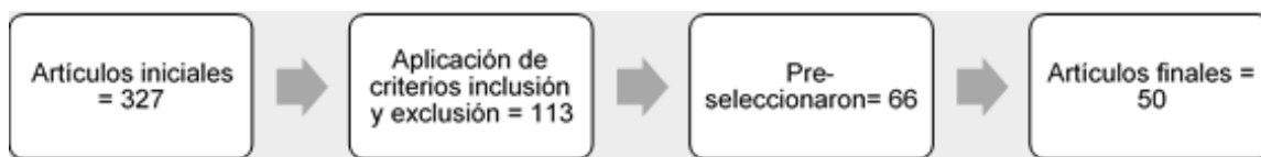
Figura 1. Proceso de selección de artículos.