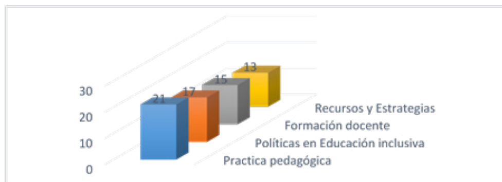
Figura 1. Categorías de estudio respecto a la revisión de artículos.

Segundo se presentan en la Tabla 1 que muestra la frecuencia de las propuestas realizados en los artículos que fueron revisados de manera minuciosa y acertada. Para interpretar los resultados se cumplieron iniciando con las categorías que muestran en menor proporción la cantidad de artículos y luego las que tienen mayor cantidad de artículos.