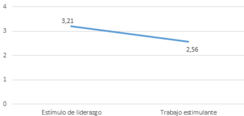
Figura 2. Valor promedio de los factores de gestión impulsores a una cultura de innovación.

Por tales antecedentes, se retomaron los dos factores mencionados para identificar en los participantes, la frecuencia de ejecución de sus características en el trabajo. En la Figura 2 se exhiben los resultados promedio.