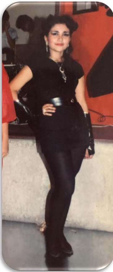
1988, Club de Leones Rocafuerte, disfrazada de Gatúbela.