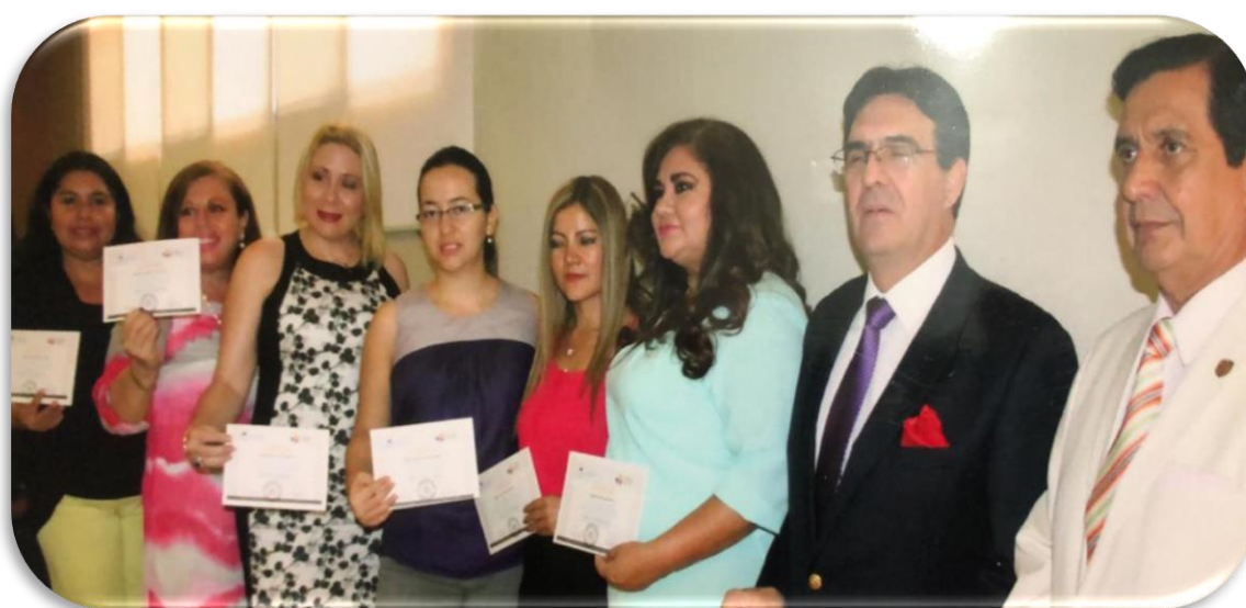
2016, Edificio de Rectorado de la UG, luego de sesión de entrega de certificados como Formadores de Formadores, por el CES y la UG.