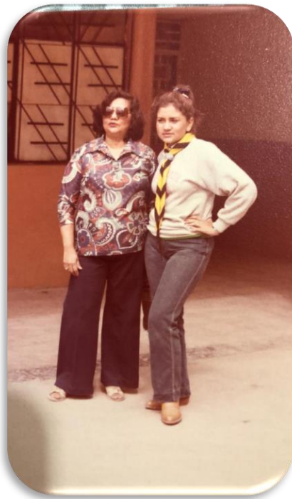
1979, en el acotamiento del Grupo Scout #14- San José la Salle, en Azogues, acompañada de mi mamá.