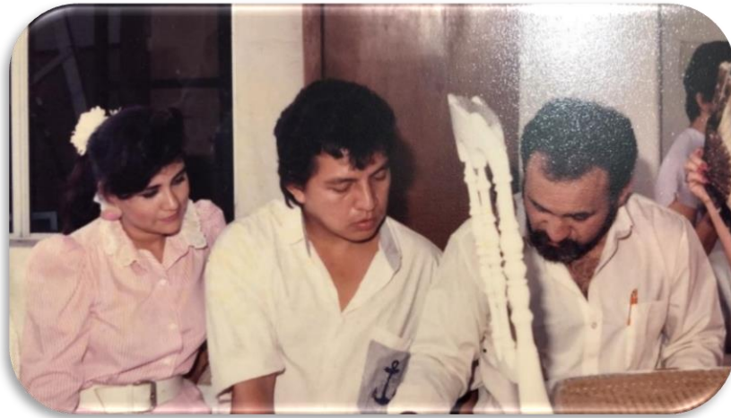
1985, curso de taller en la ESPOL. Tema: restauración de obras de arte.