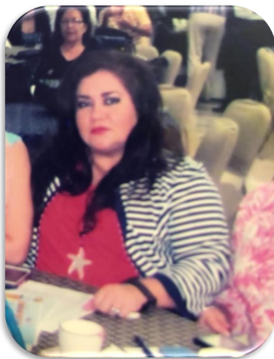
2015, Hotel Ramada, capacitación del CEACES, sobre evaluación de las universidades