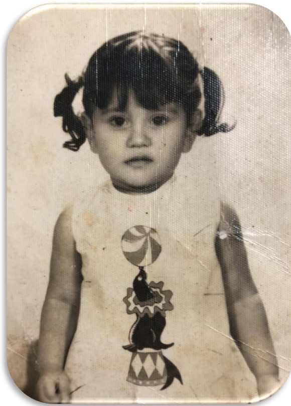
11 meses de edad, 1966