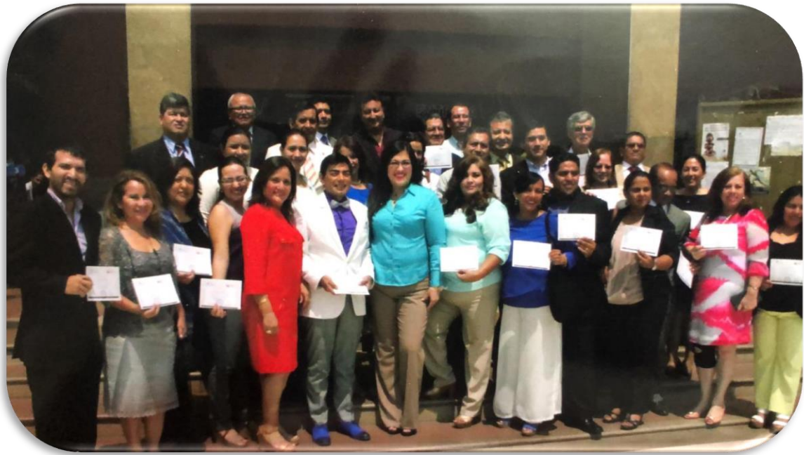
2016, sala del Honorable Consejo Universitario UG, luego de sesión de entrega de certificados como Formadores de Formadores, por el CES y la UG.