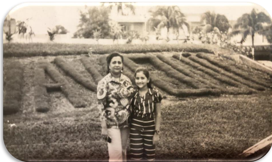
1972, en el parque de Guayaquil, (en la actualidad Plaza Rodolfo Baquerizo), acompañada de mi mamá.