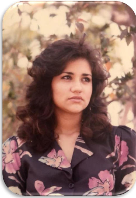
1986, Parque de Urdesa, sesión de fotos para comercial.