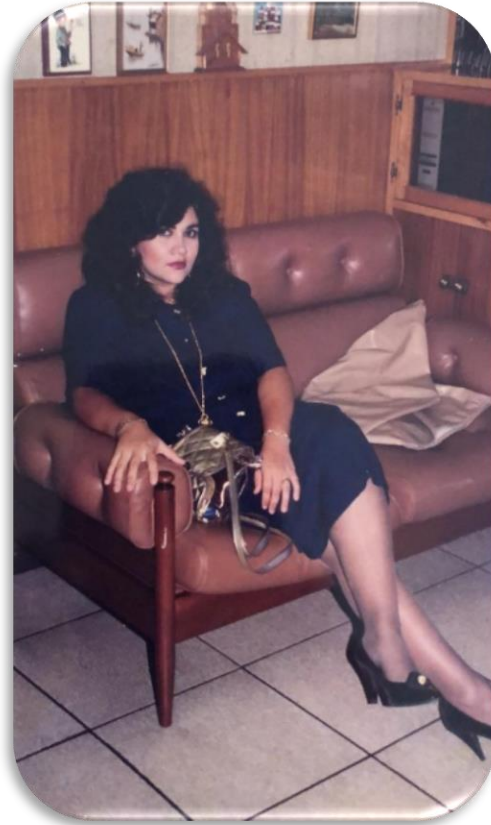
1995, en casa de mis suegros