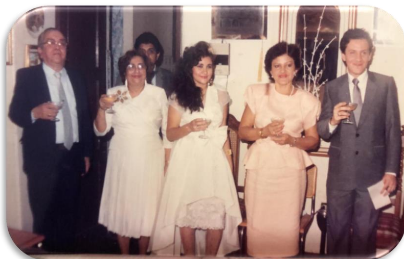
1990, en mi boda civil, en casa de mis padres.