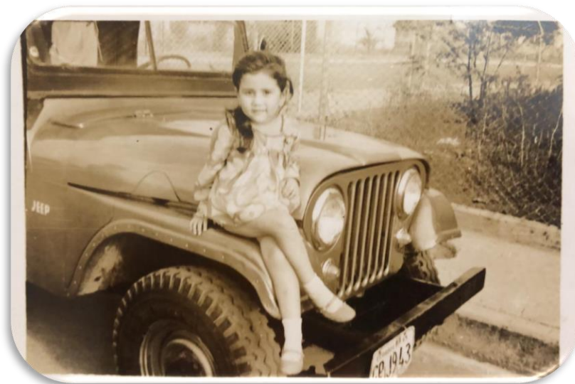
1968, paseo familiar.