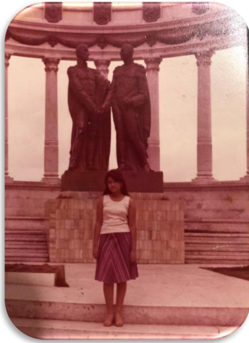
1977, en el Hemiciclo de la Rotonda monumento en el homenaje al encuentro entre Simón Bolívar y José de San Martín.