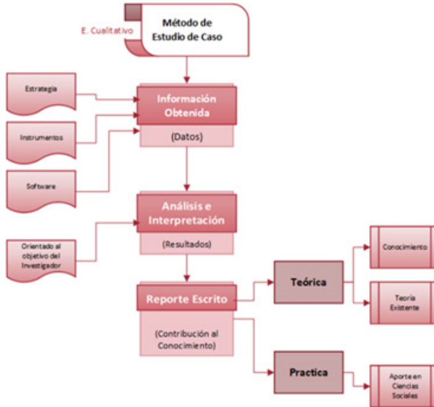
Figura 1. Adaptado de Métodos cualitativos de investigación : una aplicación al estudio de caso. (Avolio, 2015). Recuperado de http://www.ebooks7-24.com.ezproxybib.pucp.edu.pe:2048/?il=2133

caso y del análisis transversal de casos, de no ser así el estudio no tendrá una buena calidad (p. 106).