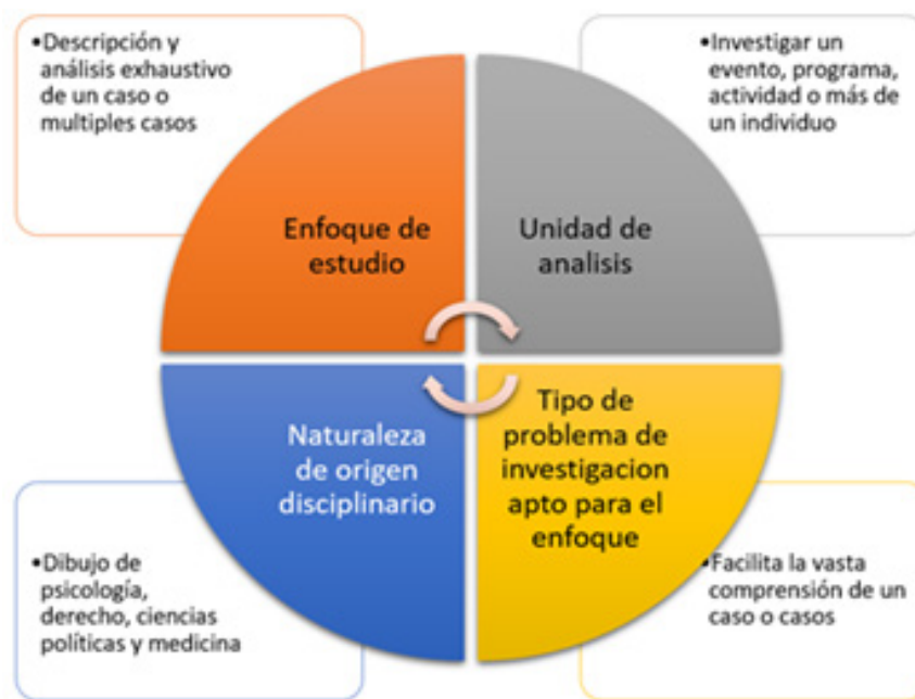
Figura 2. Consideraciones fundamentales del estudio de caso. Adaptado de Investigación cualitativa y diseño de investigación: elegir entre cinco enfoques. (Creswell y Poht, 2018).

Como séptimo punto, se determinó que es viable la aplicabilidad de los instrumentos cuantitativos en el método de estudio de caso, en tal sentido, una síntesis de investigación cualitativa ayuda a plasmar los resultados de las revisiones cuantitativas, con un énfasis emergente en los enfoques individualizados, ello permite crear una lista de recomendaciones (Flemming, Closs, Hughes, y Bennett, 2016).