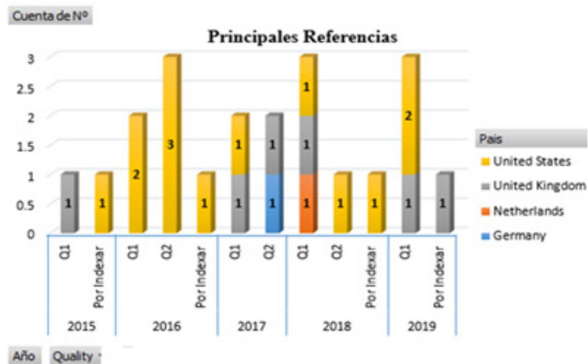
Figura 4. Análisis de artículos seleccionados.

investigación, preferentemente en idioma inglés de los Estados Unidos, Reino Unido, Holanda y Alemania. Del mismo modo, la mayor proporción de los 21 research papers seleccionados, es decir 17, están incorporadas por Scimago Institutions Rankings en los Cuartiles 1 y 2. (Figura 4).